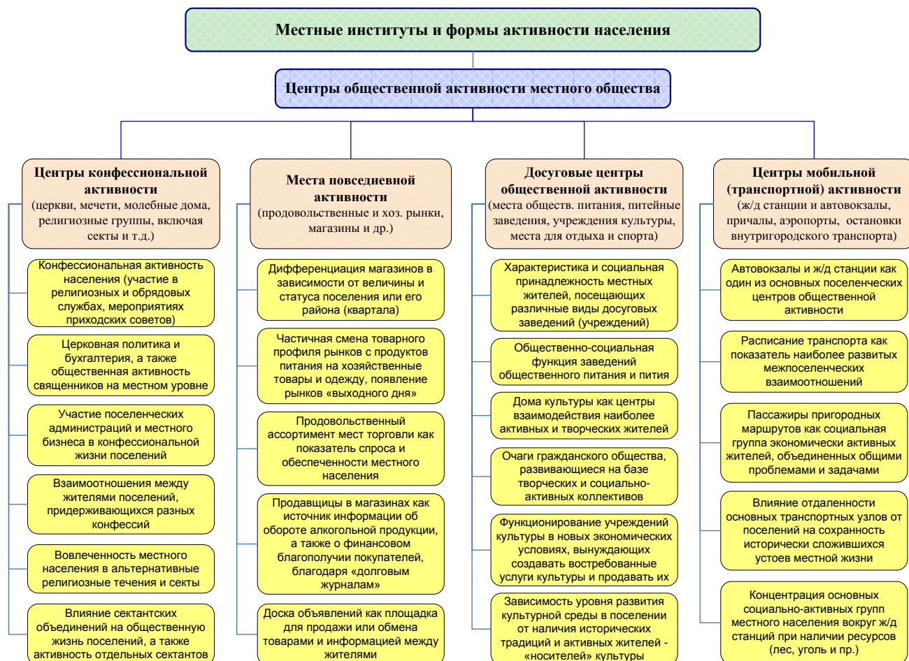
Рис. 1. Структура центров общественной активности местного общества.

Центры общественной активности представляют собой отдельный институт, а скорее даже несколько институтов местного сообщества. Следует выделить такие центры, как торговые площадки (рынки, магазины), досуговые центры поселений (места общественного питания, питейные заведения, клубы и дома культуры, места для отдыха и спорта), транспортные узлы поселений (железнодорожные станции и автовокзалы, остановки общественного транспорта), центры конфессиональной активности (церкви, мечети, молебные дома, религиозные группы и объединения) (см. Рис. 1).