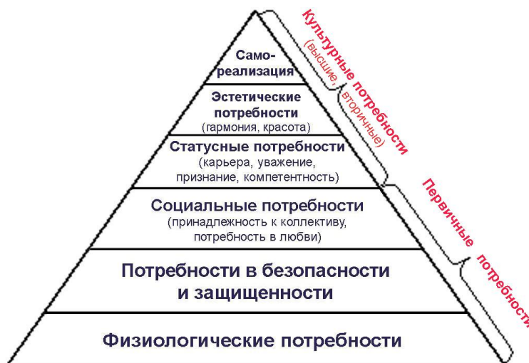
Рис. 3. Иерархическая модель (пирамида) потребностей человека А. Маслоу.

Наименьшим спросом среди местного населения пользуются музеи, посещаемые в дни открытия новых выставок (если это случается), в рамках обязательных школьных экскурсий, или приезжими (туристами). Представляется, что на данном этапе развития культуры и уровня жизни в поселениях, нет таких рычагов воздействия, способных пробудить интерес местных жителей к истории и культуре своей земли (села, города) . Обращаясь к пирамиде иерархических потребностей человека А. Маслоу (см. Рис. 3), можно сделать вывод о том, что развлечения (зрелище) в форме концертов и дискотек не предусматривают глубокого осмысления, духовной работы, понимания или изучения предмета, а музеи как раз требуют определенных душевных затрат, и относятся скорее к высшим культурным потребностям.