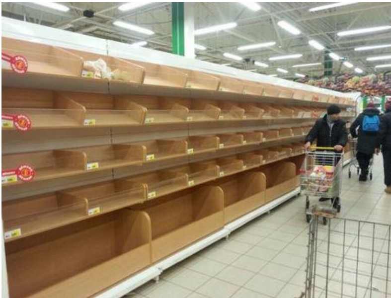
Гипермаркет «О'КЕЙ» на Северном, Ростов-на-Дону.

На заседании Ростовской городской Думы в феврале подводились первые итоги происшедшего. Основными проблемами, с которыми столкнулся город, были названы организация работ по очистке территории от большого количества снега в ограниченное время, транспортное обеспечение населения и обеспечение продуктами питания, в том числе хлебобулочными и молочными изделиями. Всего в снегоуборочных работах было задействовано в ночное время суток порядка 280 единиц техники, в дневное время суток – более 100 единиц техники. В период с 28 января по 10 февраля вывезено более 180 тысяч тонн снега. «В докладе были названы три причины проблемной ситуации, сложившейся в городе... Я бы добавил четвертую причину – совершенно необъективную картину, подаваемую местными СМИ. Нет, чтобы помочь, призвать людей лишний раз не выходить, не выезжать на машине – на протяжении всех дней чрезвычайной ситуации мы слышали постоянную критику», – отметил депутат Виталий Лазарев. ГИБДД Ростовской области было рекомендовано ограничивать движение частного автотранспорта в дни чрезвычайных ситуаций – самое простое из возможных решений.