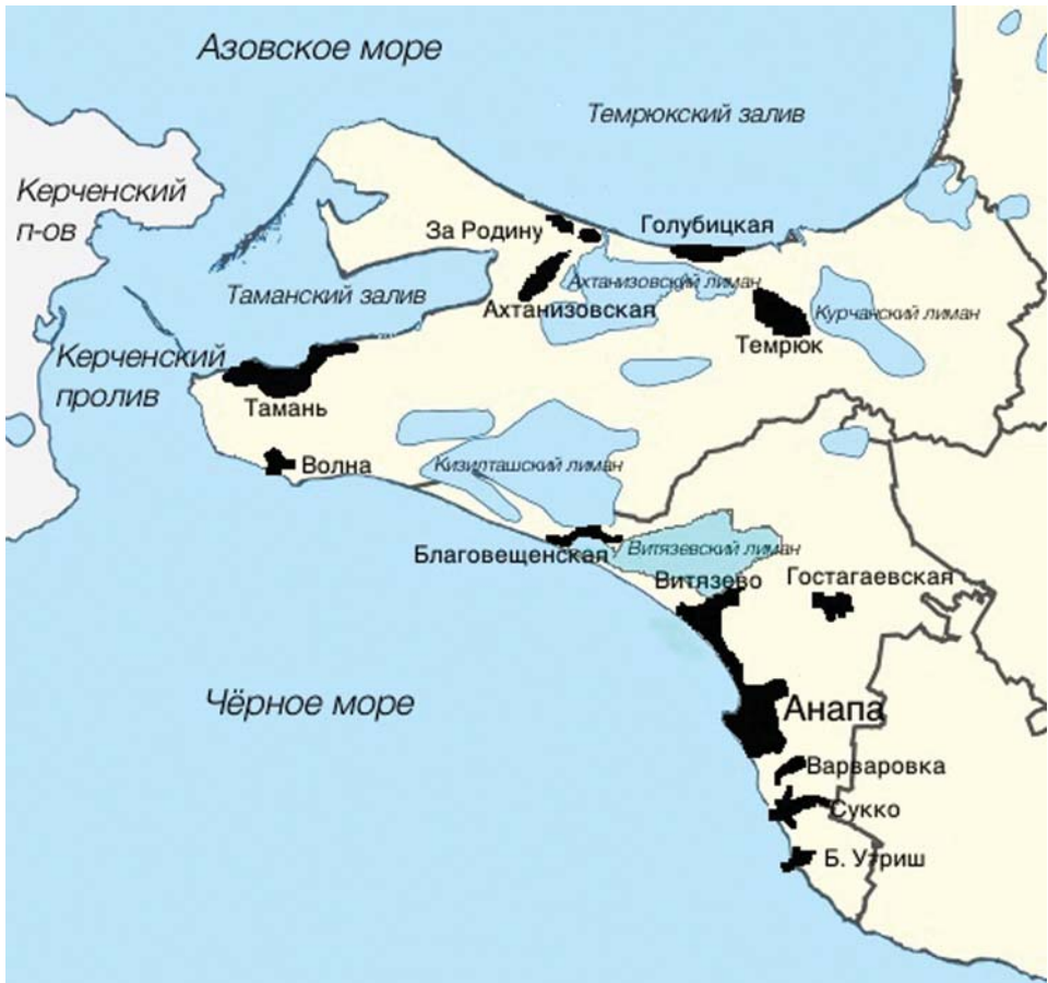
Рис. 1. Карта-схема местных обществ Таманского полуострова и Анапской округи, где проводилось изучение промысловой активности населения

новые ресурсы, как санаторно-курортные и бальнеологические (курортологические свойства Черного и Азовского морей, лиманов и пляжей, физические потребности и финансовые средства отдыхающих и туристов). Большинство промыслов неформальны и реализуются домохозяйством в целом, что в значительной степени снимает вопрос структуры социальной группы. Описание практики включает характер и трудоемкость переработки сырья, технологичность процессов добычи и переработки, необходимость в специальных инструментах и технике, интенсивность промысловой активности по трудозатратам и затратам времени, характер утилизации продукции (особенности и способы продажи), доходность промысла и его доля в семейном бюджете, а также место каждого вида